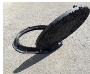
Samostoječ pokrov v nagibu 125° - z varovalom proti zapiranju